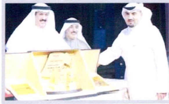
تكريم البنك الوطني