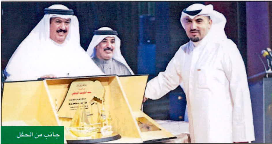
جانب من الحفل

وأوضح أن مستقبل الكويت وثروتها الحقيقية تكمن في شريحة الشباب، حيث يولي بنك الكويت الوطني أهمية كبرى للمساهمة والدعم في الارتقاء بمستواها الأكاديمي والمهني، إيماناً منه بالدور البارز الذي سيلعبه الشباب في مستقبل البلاد.