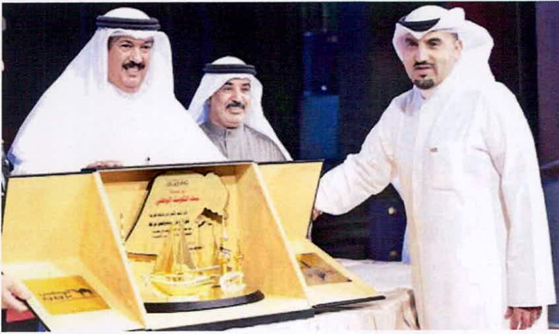
تكريم بنك الكويت الوطني

قدم بنك الكويت الوطني رعايته لحفل تخريج الدفعة الثانية في برنامج تفتيش أمن المطار التابع للمعهد العالي للخدمات الإدارية. وذلك في إطار المساهمة الفاعلة التي ينفجها البنك في دعم وتنمية الكوادر الكويتية الشابة. وضم حفل تخريج الدفعة الثانية من برنامج تفتيش أمن المطار للعام التدريبي 2018 - 2019 نحو 260 طالباً وطالبة بواقع 251 طالباً و9 طالبات.